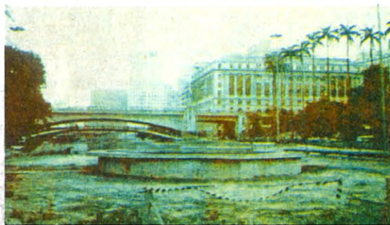
Vista das obras de reurbanização do vale do Anhangabaú, em SP

Em uma das tardes que passou sentada à frente da tela do computador, por exemplo, Denise resolveu o problema que mais lhe causou dores de cabeça. Uma das peças da escultura, com cinco metros de altura e base de apenas