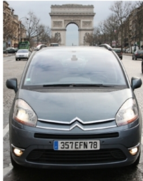
A minivan Citroën Grand C4 Picasso